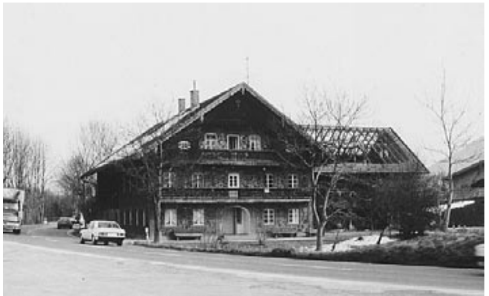
Er war der letzte Hof von St. Zeno an der rechten Seite der Straße nach Salzburg vor der Gemeindegrenze zu Marzoll. Der „Schafferbauer“ musste für den Neubau der Straße in den 90er Jahren umsiedeln, der alte Hof wurde abgerissen (Bild).