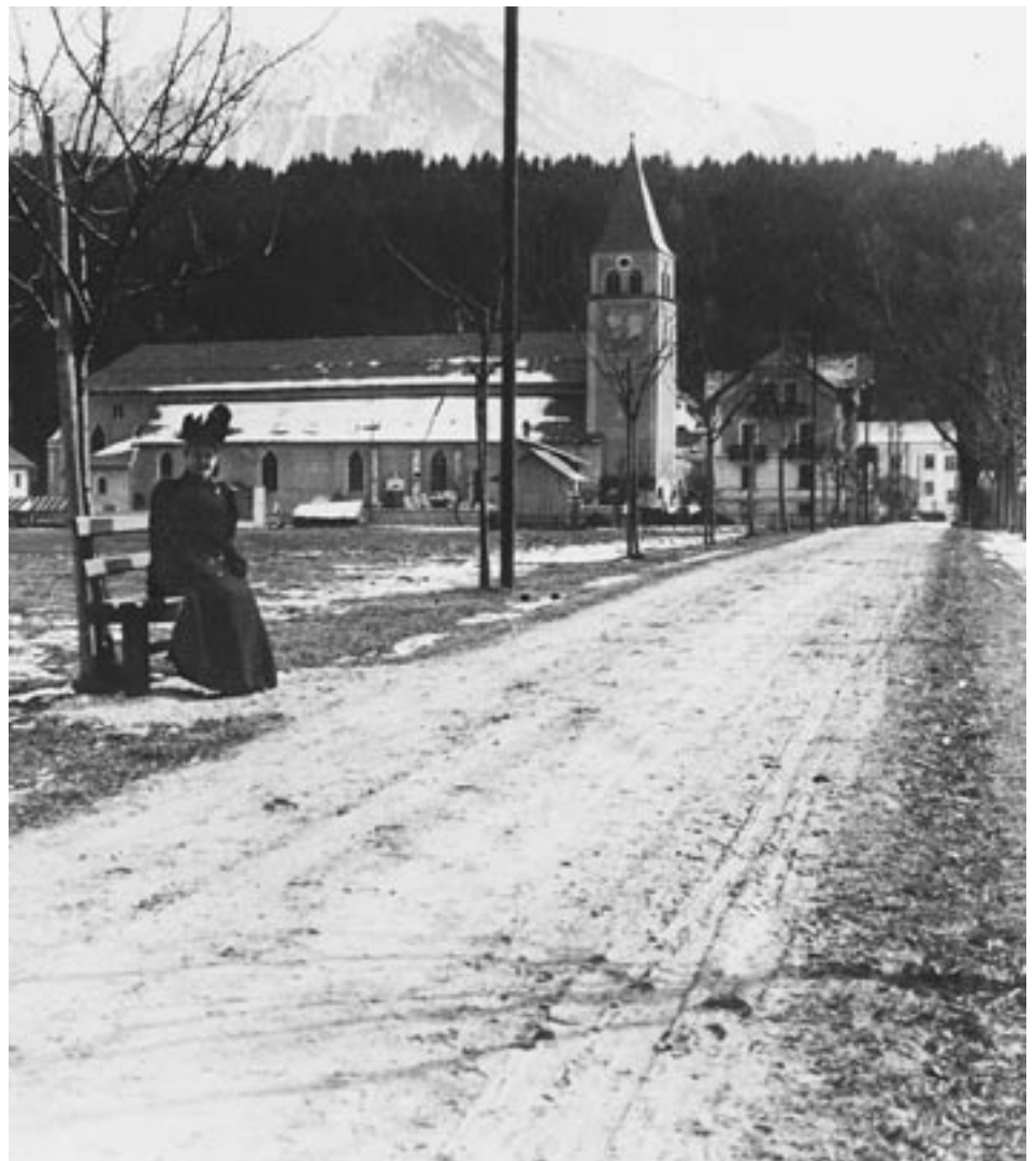
Dame auf Bank vor dem Münster St. Zeno: eine der ersten fotografischen Aufnahmen aus dem neu eingliederten Stadtteil. Die Zenostraße war damals noch links und rechts von Wiesen eingesäumt.

gen zu den Eingemeindeverhandlungen zu treffen. Im Kurzen nun die Vorverhandlungen im Jahre 1905: Die Denkschrift des Bürgermeisters über die Eingemeindung von St. Zeno erscheint im Druck und findet wegen ihrer Objektivität in weiten Kreisen der Bevölkerung Zustimmung. Die Gegner der Eingemeindung in St. Zeno befürchteten größere finanzielle Belastung der Bürger, die Reichenhaller Geschäftsleute Schädli-