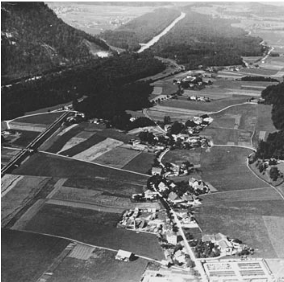
Das alte Froschham aus der Luft: ein Straßendorf mit ländlichem Charakter.