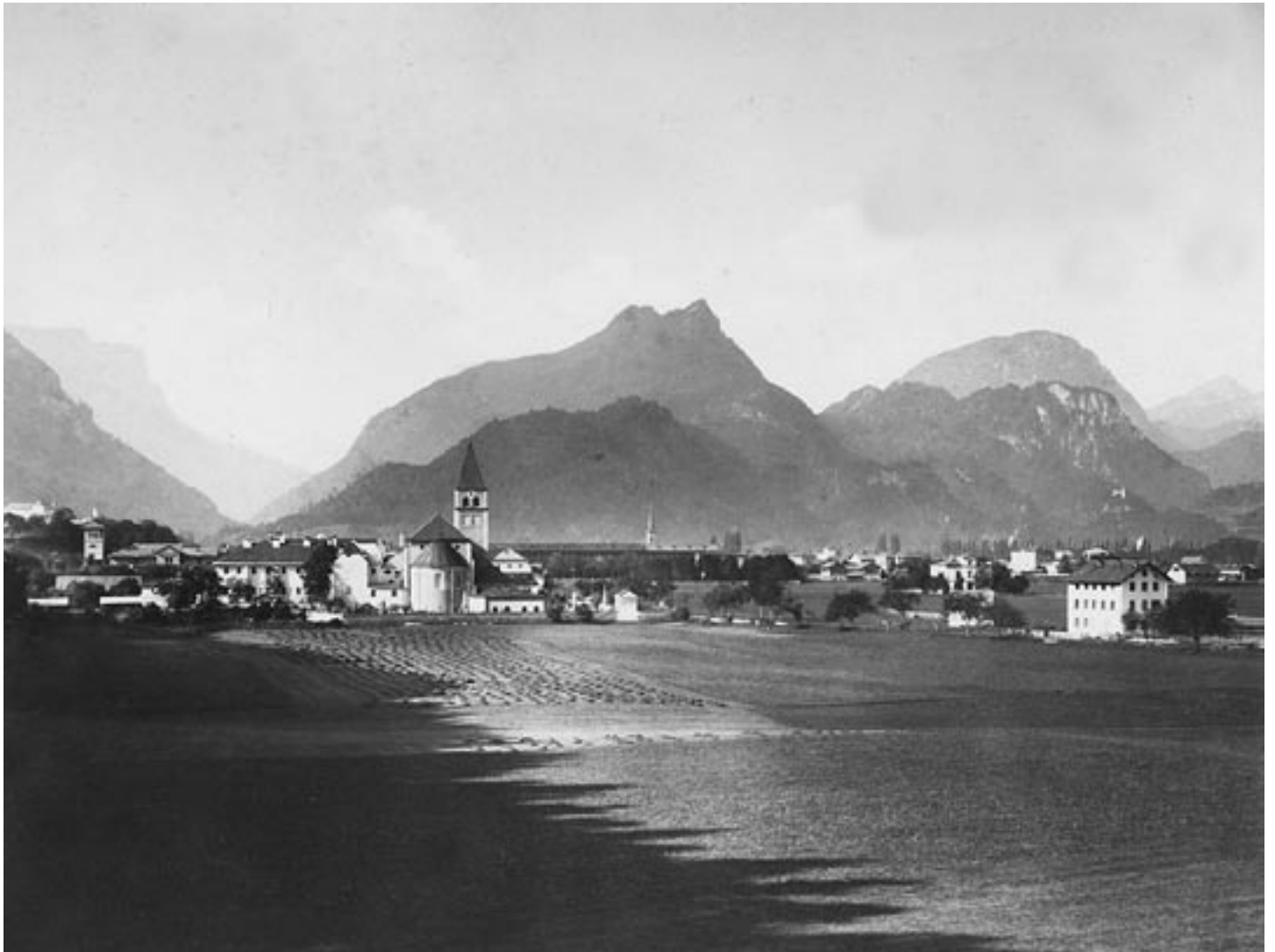
Nach dem Münster war vor hundert Jahren die geschlossene Bebauung in Richtung Osten zu Ende. Nur vereinzelte Häuser säumten die Salzburger Straße, links im Hintergrund Burg Gruttenstein und der Turm der Villa Karg, heute Karlsqymnasium.

Die Eingemeindung der schuldenfreien Gemeinde brachte der Stadt 165 ha Fläche mit über 900 Einwohnern. Das Häuserverzeichnis von St. Zeno vom