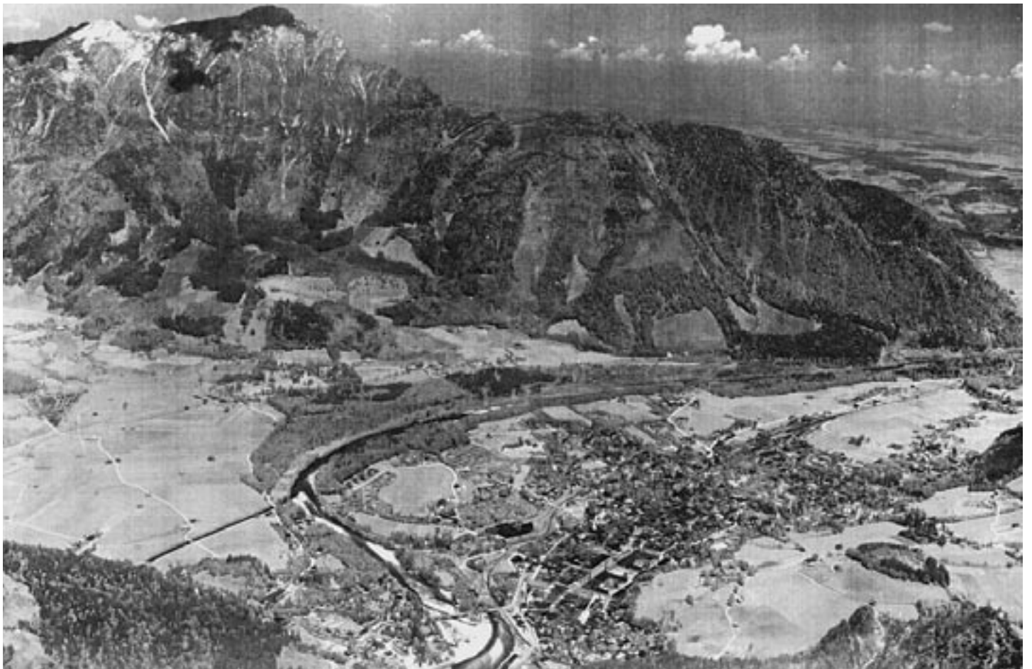
Wie groß die un bebauten Gebiete in Bad Reichenhall zu Beginn des 20. Jahrhundert noch waren, zeigt dieses Bild vom Predigstuhl: rechts die Felder von Froschham, links die Weitwiese in Karlstein, im Saalachbogen das Kassierfeld.

Am 1. Dezember 1719 gestattete der bayerische Kurfürst Max Emanuel dem Stift St. Zeno, ein Brauhaus für braunes Bier zu errichten mit der Auflage, dieses nur für den Hausgebrauch zu nutzen. Das Stift scheint aber großzügig mit der Auslegung der Bierkonzession umgegangen zu sein. So war der Streit zwischen den Brauern und der Stadt vorprogrammiert. Am 24. Januar 1789 zerstörte ein Brand die Brauerei. Man braute nun in Höglwörth und baute dann das Brauhaus in St. Zeno wieder