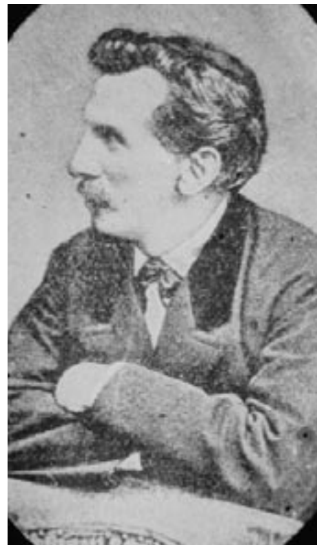
Franz Ritter von Brandl.

1. Knollbäck-Lehen, 2. Steilhof, 3. Trettgütl oder Metzgerlehen, 4. Kreuzmacher, 5. Reitsamer, 26. Hofwirt, 27. Schuhmacher, 28. ehemaliges Klosterge-