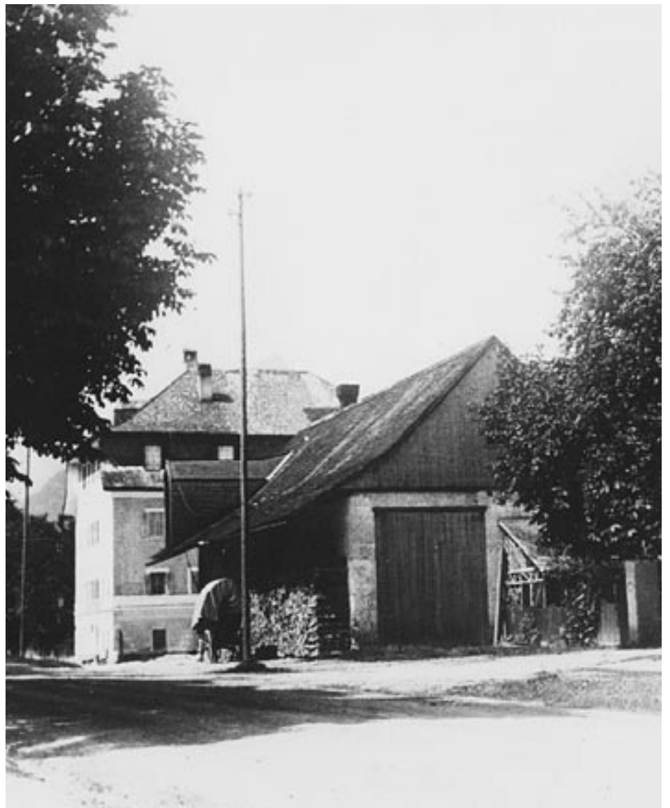
Der Hofwirt mit Stadel und Planwagen in der Remise: Idyll aus dem alten St. Zeno vor den Toren der Stadt Bad Reichenhall.