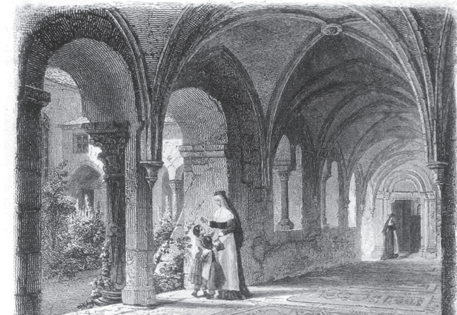
Im Kreuzgang des Klosters St. Zeno, nach einem alten Stich aus der 2. Hälfte des 19. Jahrhunderts, gezeichnet von F. Rothbart, gestochen von J. Riegel.

Die Sozialdemokraten hatten es auch nach der Aufhebung des Sozialistenverbotes noch immer schwer, sich in den Kleinstädten zu gründen. Nach dem Hinauswurf aus dem „Weißen Rößl“ bekamen sie das Gasthaus „Zum Tiroler Tor“ als Vereinslokal. Später wurde das Gasthaus „Blaue Traube“ zum Versammlungsort. Ein Gegner, der bei der