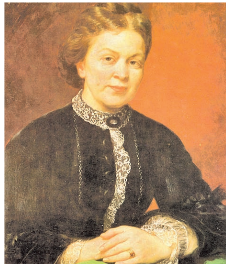
Marie von Ebner-Eschenbach 1873 nach einem Gemälde von Karl Blaas.

Das Kloster St. Zeno und damit auch die Schule war – mit zwei Ausnahmen – Marie v. Ebner-Eschenbachs Domizil in ihrer Reichenhaller Zeit. Es ist anzunehmen, dass sie mit der ihr eigenen Beobachtungsgabe registrierte, was sich im Institut abspielte, wie man dort die „höheren Töchter“ erzog. Vermutlich fand sie vieles bestätigt, was sie an ihre eigene Erziehung erinnerte und was sie ablehnte. „Ich möchte in St. Zeno wohnen und die armen Kinder dort erziehen“, notierte sie in ihr Tagebuch am 15. Juni 1872 (Sie wohnte damals in „Curhaus Achselmannstein“). Es muss offen gelassen werden, inwieweit Marie v. Ebner-Eschenbach, die in ihren Werken immer wieder eine einfühlsame, kindgerechte Erziehung einforderte – auch das „Erdbeerfrau“-Gedicht verrät dies –, bei ihren Besuchen im Institut St. Zeno mit pädagogischen Fragen konfrontiert wurde. Die Halbbildung, die die Mädchen dort genossen, bei der oberflächliches Wissen genügte und korrektes gesellschaftliches Verhalten wichtiger war, lehnte sie jedenfalls entschieden ab. Mit solchen Erziehungszielen konnte die Dichterin nicht übereinstimmen.