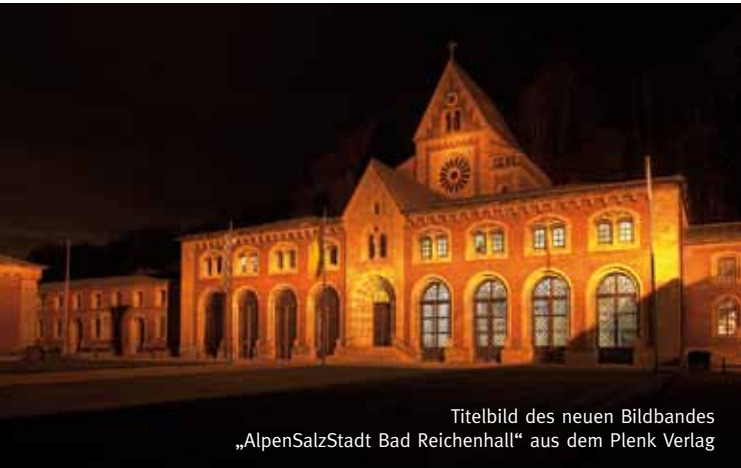
Titelbild des neuen Bildbandes „AlpenSalzStadt Bad Reichenhall“ aus dem Plenk Verlag